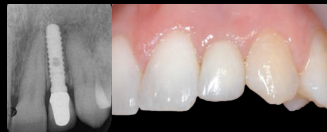
Fig. 3 - Implante com Platform Matching

O conceito PLS tem resultados positivos na preservação óssea crestal peri-implantar. Contudo, tal poderá muitas vezes não se traduzir necessariamente em diferenças objetivas no resultado final a nível estético, comparativamente ao Platform Matching , pelo que a verdadeira relevância clínica deste conceito permanece ainda em discussão.