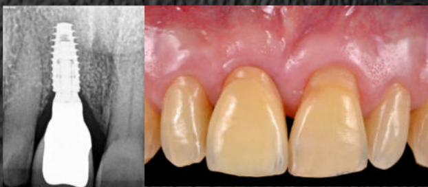
Fig. 2 - Implante com Platform Switching (PLS)

Obtiveram-se um total de 18 artigos. Observou-se uma perda óssea crestal ligeiramente superior em redor de implantes com Platform Matching comparativamente a implantes com PLS 1-5 . Este facto sugere que a localização do microgap possa ter influência na manutenção dos tecidos duros peri-implantares 3,4 .