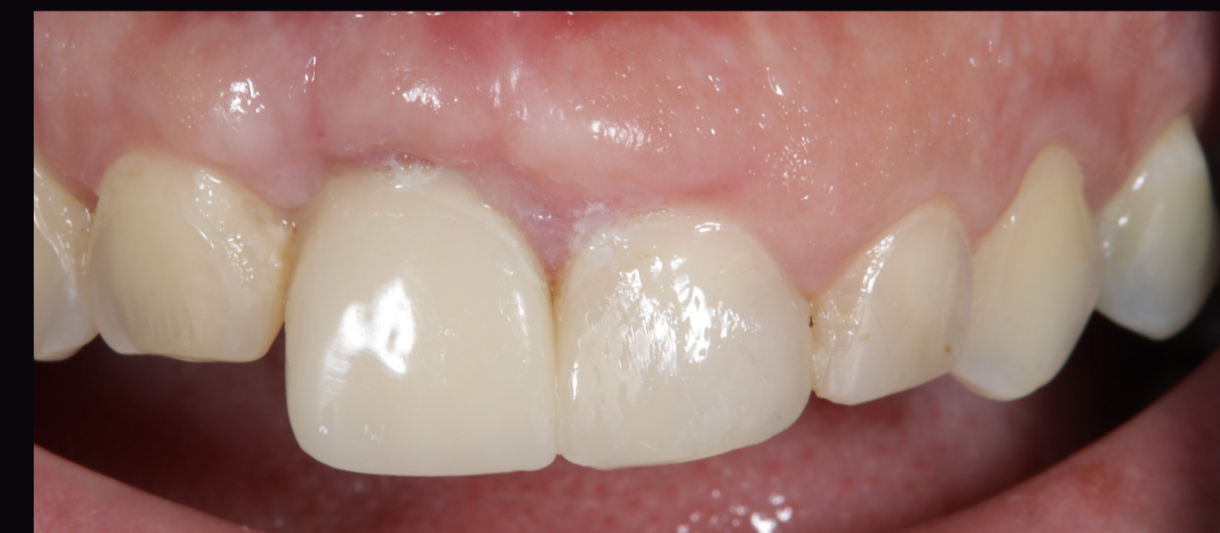
Figura 4- Coroa Provisória sobre implante em PMMA.