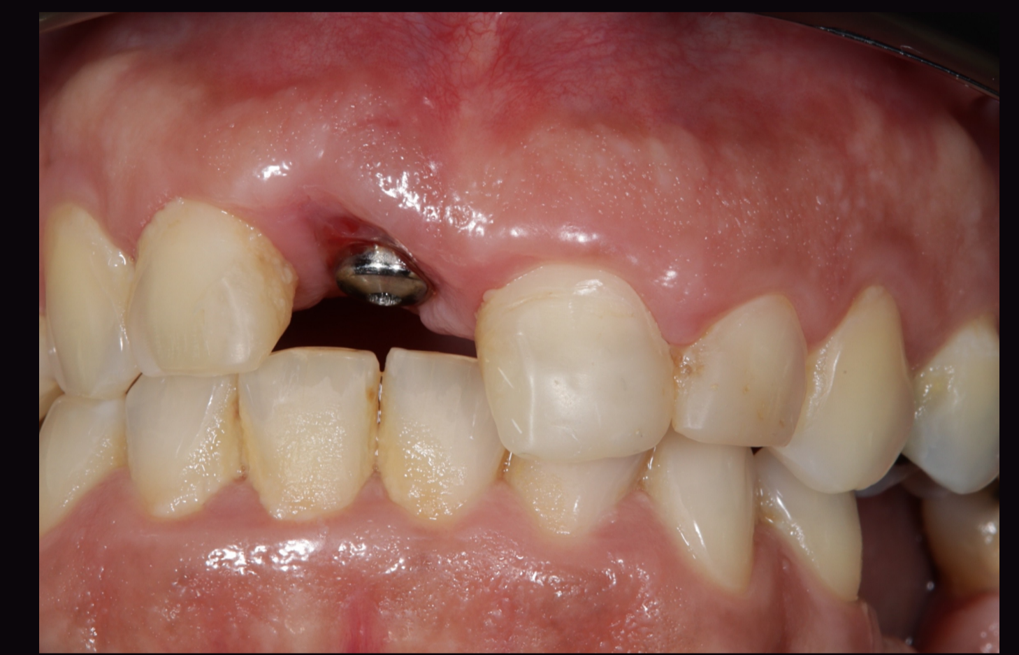
Figura 2 – Fotografias intra-orais iniciais.