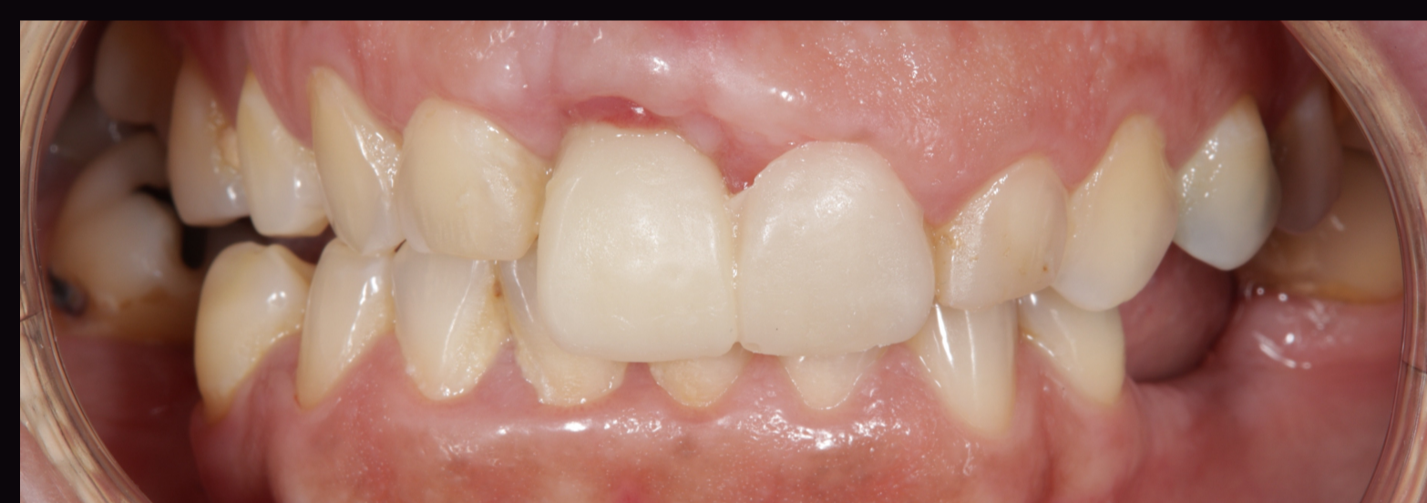
Figura 3- Mock-up em Resina Bísacrílica.