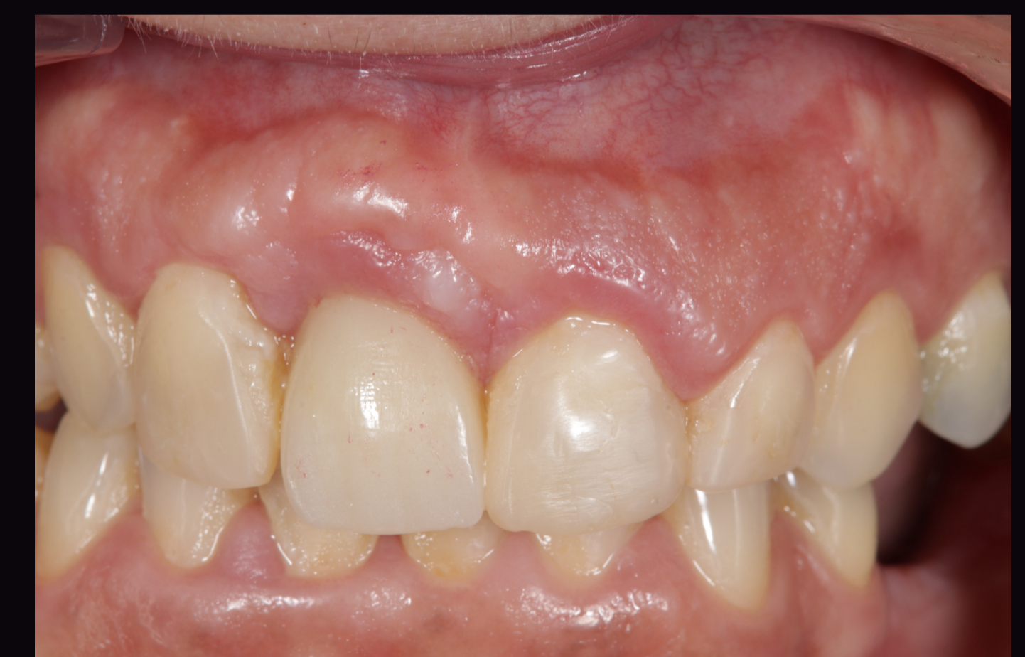
Figura 7 – Fotografias intra-orais finais.