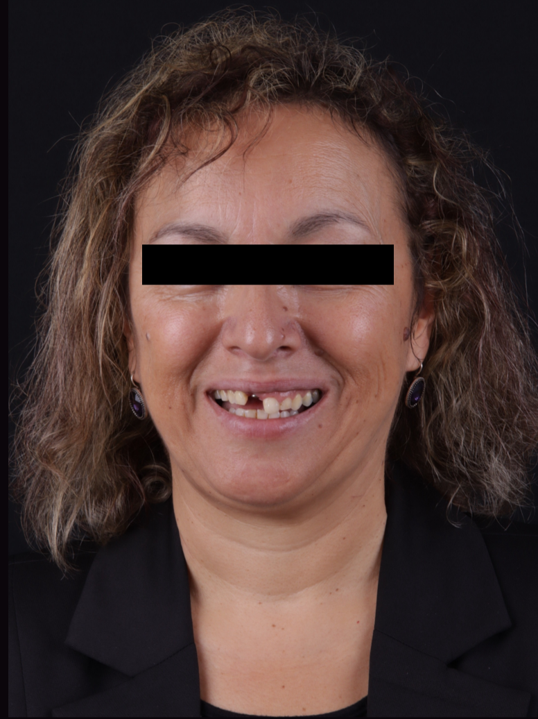
Figura 1 – Fotografias extra-orais iniciais.

Paciente do sexo feminino, com 50 anos de idade, apresentou-se na Clínica Universitária Egas Moniz para reabilitar um implante dentário no setor anterior (Fig. 1). Clinicamente o implante colocado no dente 11 apresentava um defeito gengival extenso (Fig. 2). Como plano de tratamento, propôs-se a realização de um enxerto gengival no implante e gengivectomia nos dentes 21 e 22, para corrigir a assimetria notável da margem gengival. Foi realizado um mock-up prévio à cirurgia de modo a estudar o resultado final assim como guiar a correção cirúrgica (Fig. 3), também a utilização de uma nova provisória permitiu o condicionamento gengival à nova peça protética (Fig. 4). A posterior reabilitação foi realizada com uma coroa de zircónia no implante e duas restaurações em resina composta nos dentes 12 e 21 (Fig 5, 6 e 7).