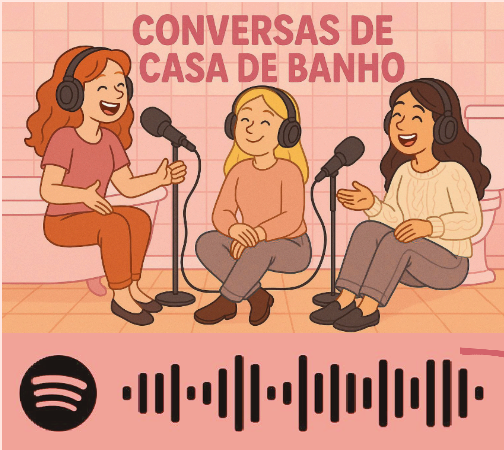
Figura 1: Podcast “Conversas de casa de banho”

Através da combinação de um questionário e de um podcast educativo, foi possível desmistificar mitos , reforçar boas práticas de prevenção e destacar o papel do farmacêutico como agente de literacia em saúde.